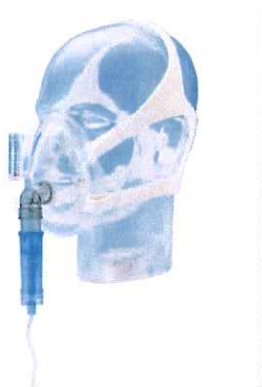
DIMAIR- EVE- CPAP Maszk

A CPAP/NIV használatával csökken a halálozás, az intubációs szükséglet, az intenzív osztályon eltöltött napok száma, illetve a fertőzőes szövődmények előfordulása. A CPAP/NIV csökkenti a légzésszámot, a szívfrekvenciát, a nehézlégzés mértékét, az acidózist és a hypercapniát, növeli a légzési térfogatot (VT – tidal volume) és a percventilációt (MV – minute volume), javítja az oxigénszaturációt (SpO 2 ). Megfelelő indikációban alkalmazva a fenti kedvező hatások valamennyi betegcsoportban érvényesülnek. A CPAP/NIV alkalmazása megfelelő együttműködés és optimális méretű maszk rendelkezésre állása esetén gyermekeknél is javasolt.