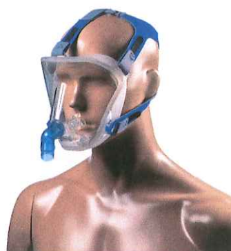
DIMAIR Total Face Standard SPU- Teljes Arcmaszk